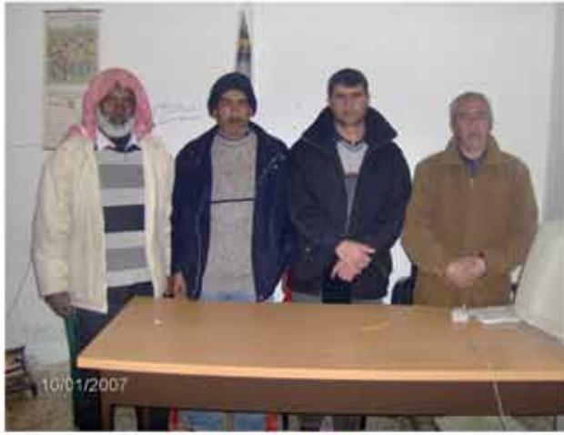
موظفوا قسم الجباية

أخي المواطن .... لمصلحتك أولا ... سدد ديونك مستغلا التنزيلات التي تستحقها، لا تجعل الديون تتراكم، وفر على نفسك العناء ... سدد ديونك ... إعرف : ... التنزيلات التي تستحقها ... المبلغ الحقيقي المستحق عليك ما عليك إلا زيارة قسم الجباية في البلدية وستحظى بنصائح جوهرية.