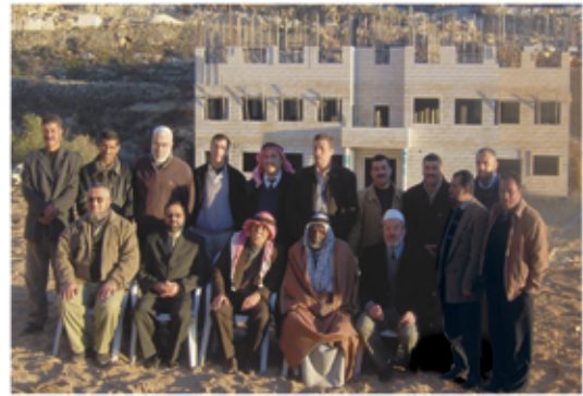
لجنة بناء مدارس تفوح

نور ونزار أولا في تحقيق أمدافنا ونيل حقوقنا