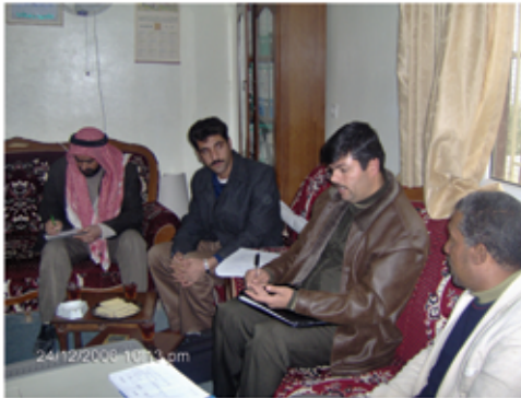
وفد مؤسسة (أريج) في زيارة للبلدية

وأصحاب الرأي والمشورة في القرارات الهامة، فشكلت اللجان المحلية الاستشارية، ولجان الأحياء من مدرء المدارس ونخبة من المعلمين، ووجهاء العشائر، وممثلي أحياء البلدة، وممثلي الطلاب والقطاع النسوي، عملت على رصد احتياجات البلدة، وتحديد الاحتياجات والأولويات حسب الإمكانيات المتوفرة في البلدية، في ظل الحصار العاشم .