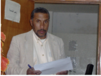
مدير شؤون الموظفين

أخي الموظف...كم هو جميل وحبيب إلى النفس أن ينظر الإنسان إلى آثار سيره، في هذه الحياة الدنيا، التي هي مزرعة الآخرة، فهذا ابن صالح قرّة عين لوالديه، وهذه دعوة ارتفعت ففتحت لها أبواب السماء لأنها من رجل أصاب حلالاً، وذلك ذكر جميل فاح عييره على السنة الكثير من الناس