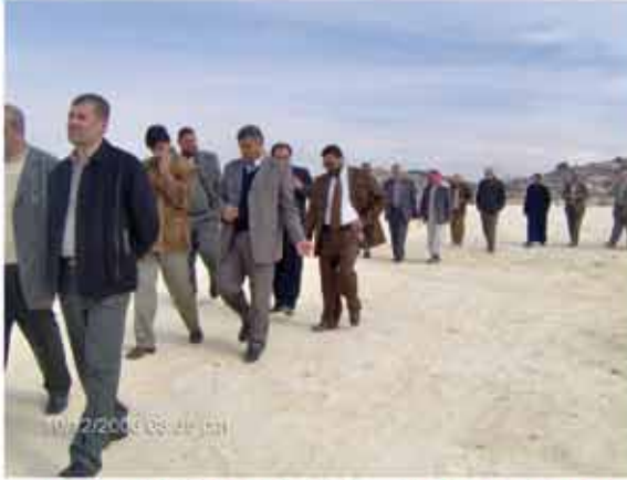
زيارة وفد رؤساء بلديات محافظة بيت لحم والخليل لبلدية تفوح

1) تدريب وتأهيل وتطوير عمل الموظفين من خلال المشاركة في دورات تأهيلية وتدريبية.