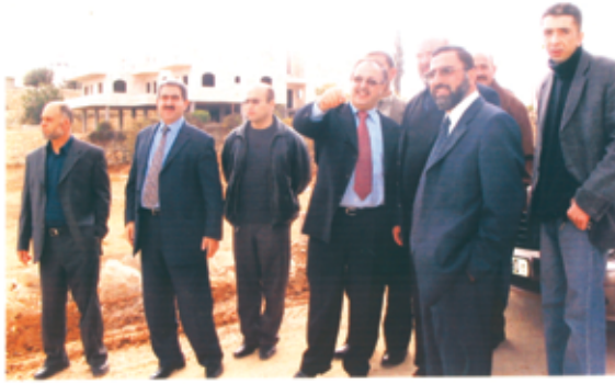
وزير الحكم المحلي م. خالد القواسمي في زيارة للبلدية

اهتمت البلدية ومنذ انطلاقتها، بتطوير علاقاتها الإيجابية، المبنية على الحوار، وتبادل الآراء، والتعاون، بهدف الوصول لعمل مؤسساتي يرقى بالبلدة على كافة الأصعدة والمستويات، من منطلق أن البلدية تعتبر المؤسسة الأكبر وتحمل اسم البلدة، فكانت العلاقات الطيبة والمتبادلة مع مؤسسات المجتمع المدني في البلدة، وخارجها، ومشاركة المجتمع المحلي