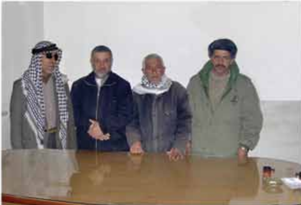
موظفوا قسم الصيانة